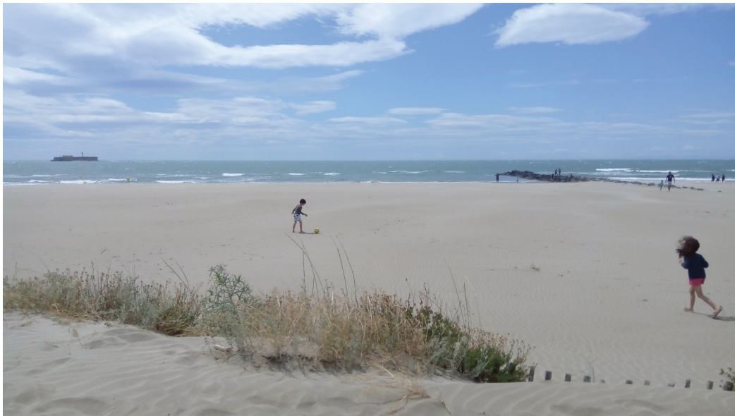
Sovimanga - Jouer avec le vent