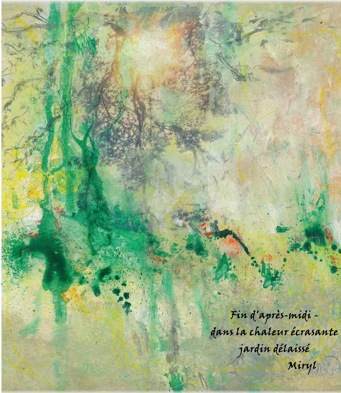
Miryl - Technique mixte